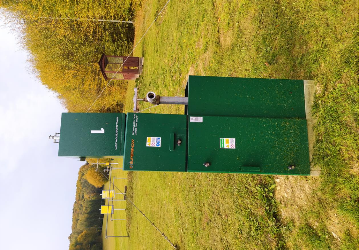
Technológia zasnežovania SKI Medvedie po realizácii