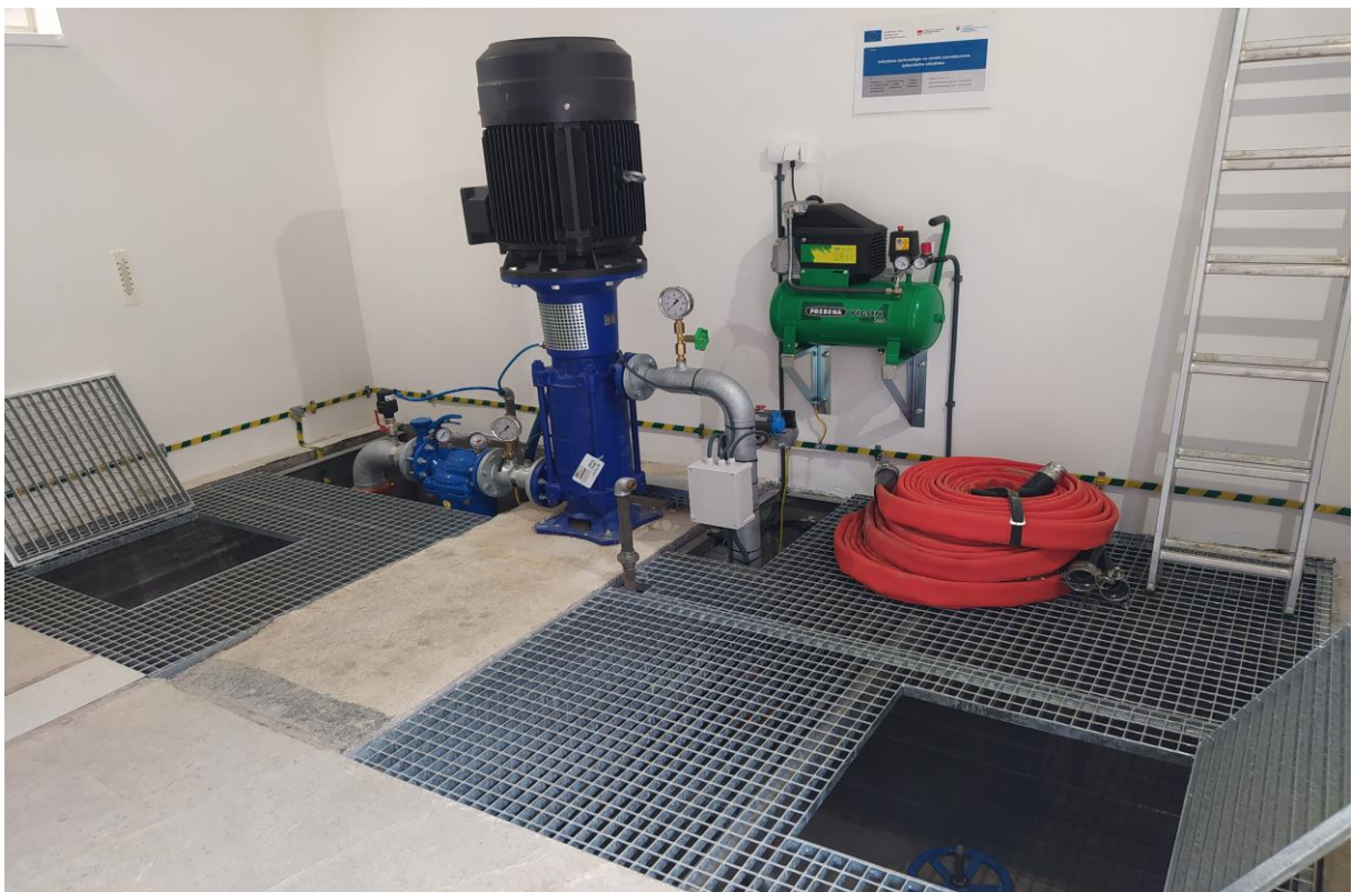
Technológia zasnežovania SKI Medvedie po realizácii