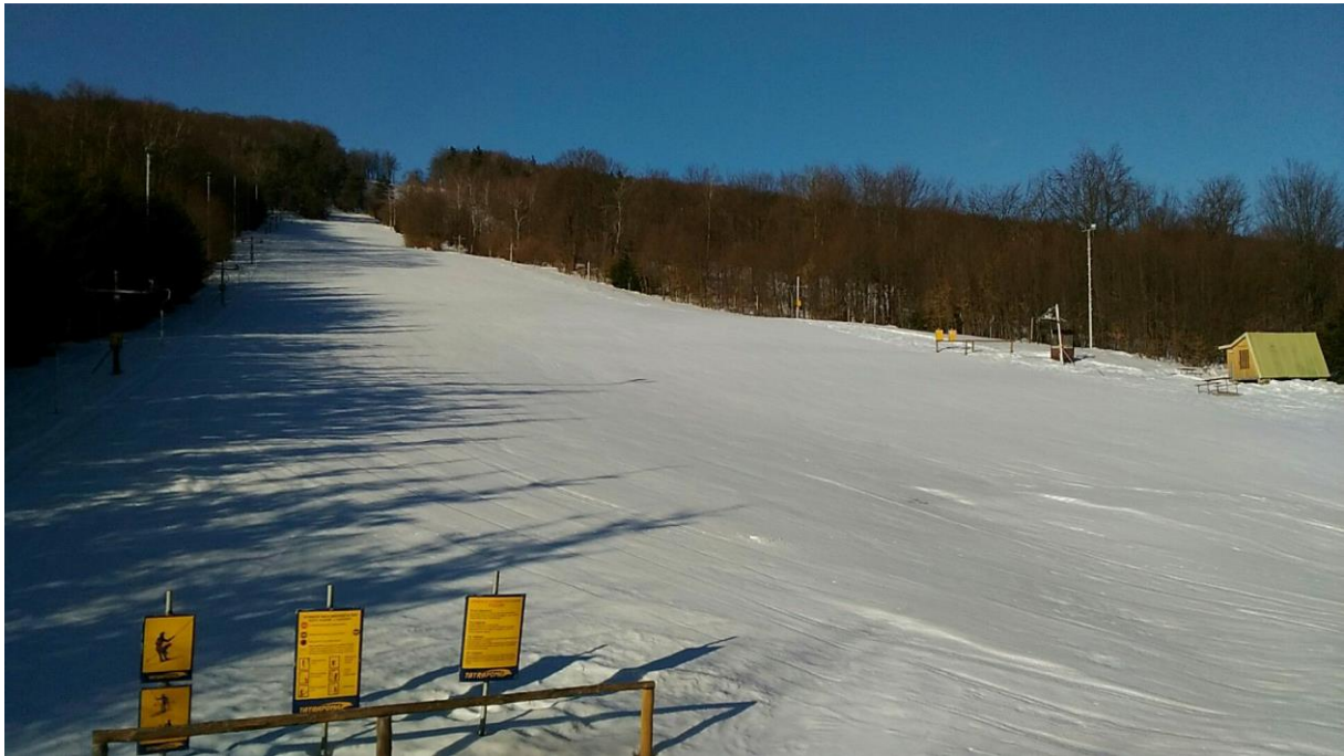
Technológia zasnežovania SKI Medvedie pred realizáciou