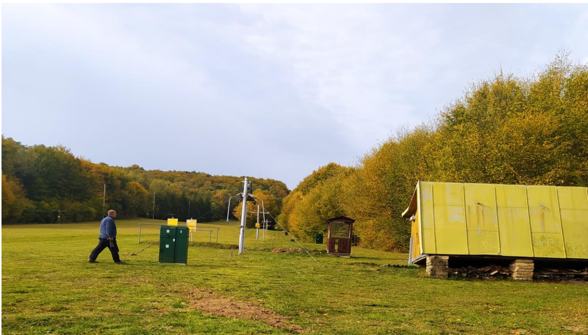
Technológia zasnežovania SKI Medvedie po realizácii