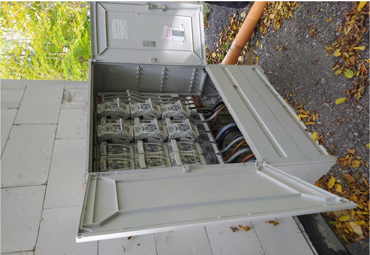
Technológia zasnežovania SKI Medvedie po realizácii