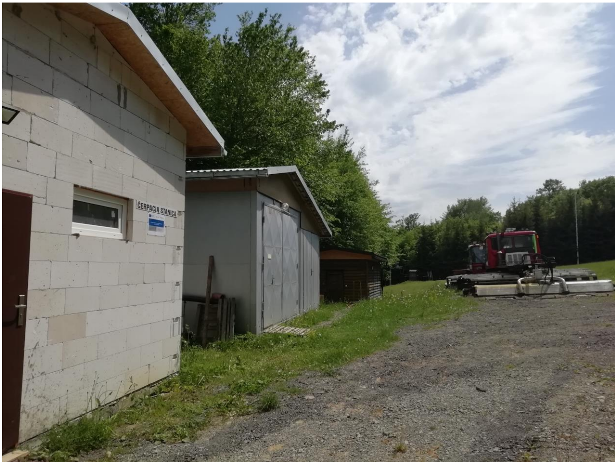
Technológia zasnežovania SKI Medvedie po realizácii