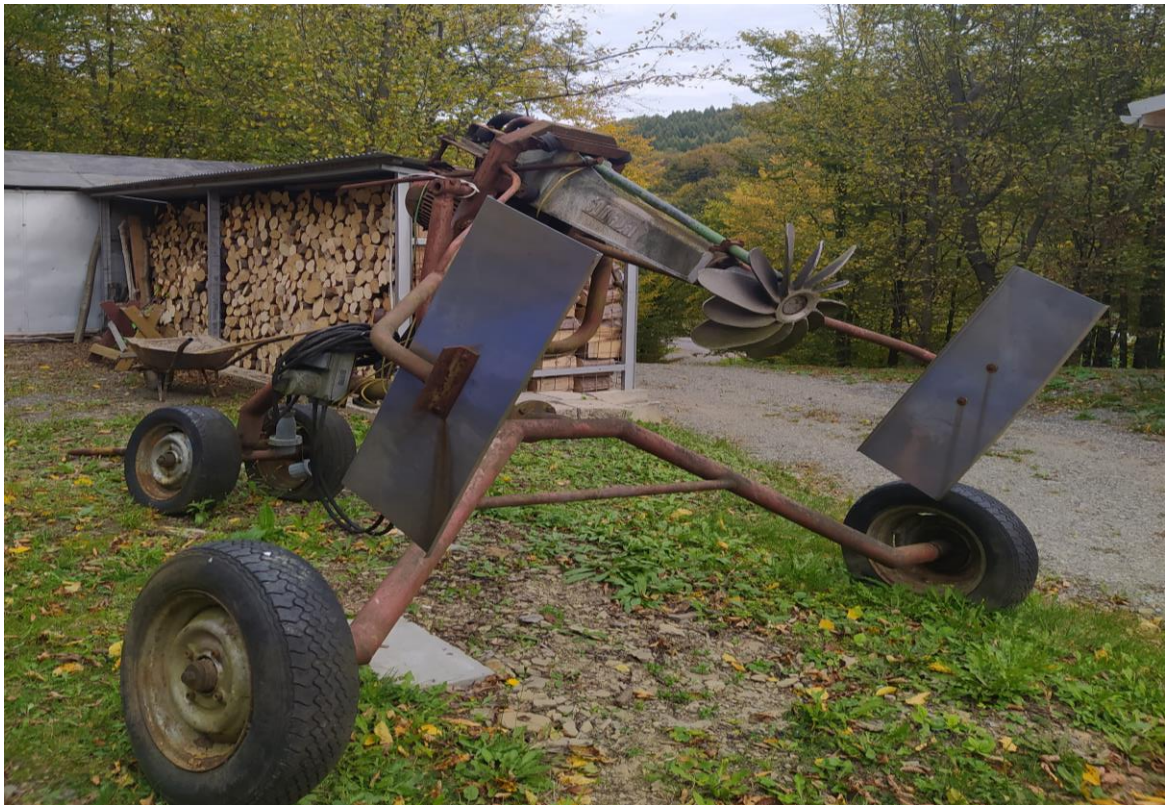
Technológia zasnežovania SKI Medvedie pred realizáciou